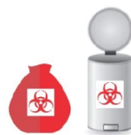
Recipiente con tapa Y sistema apertura A pedal