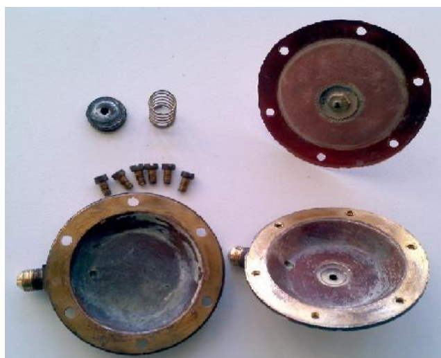
Distintos componentes del diafragma