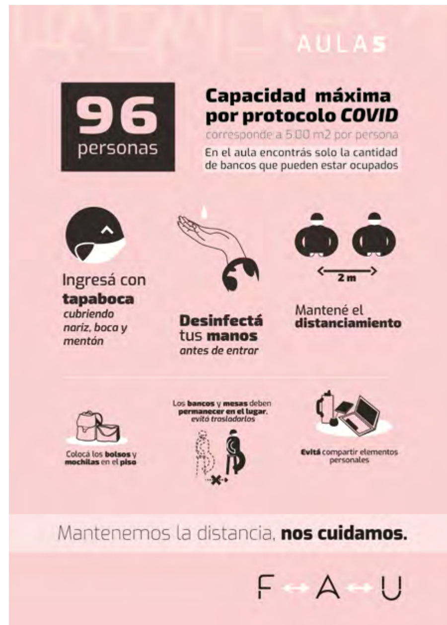
IMAGEN: Señalización aplicada en aulas