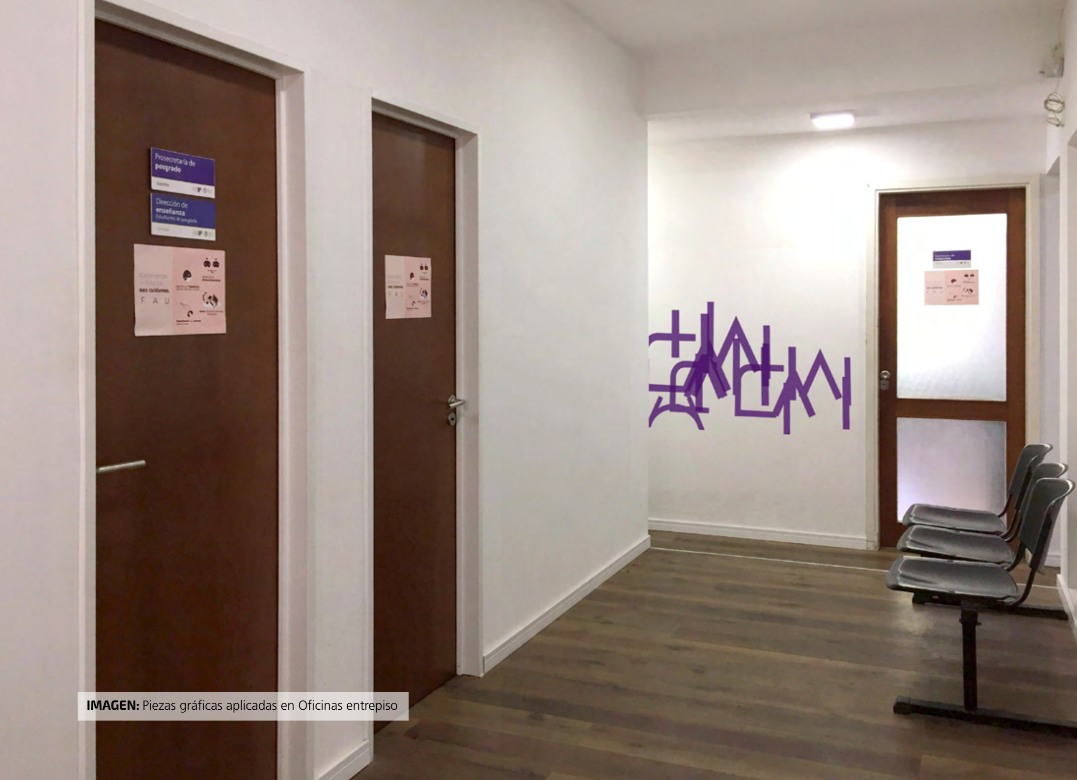
IMAGEN: Piezas gráficas aplicadas en Oficinas entrespiso