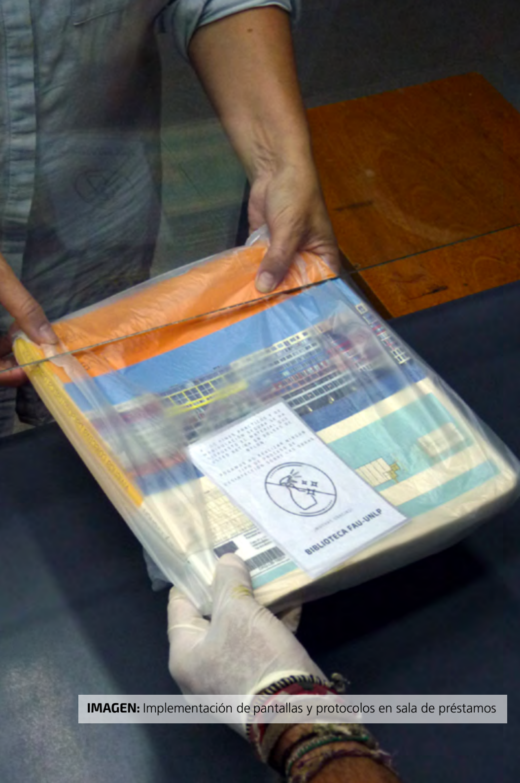
IMAGEN: Implementación de pantallas y protocolos en sala de préstamos