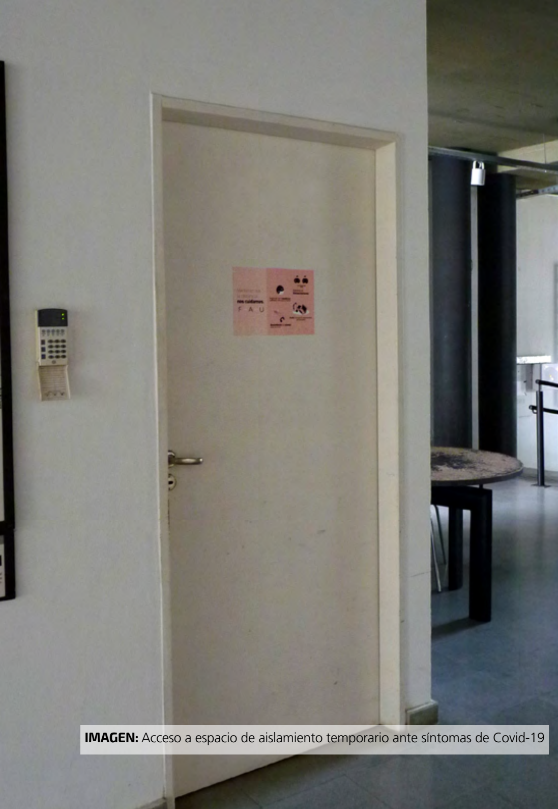
IMAGEN: Acceso a espacio de aislamiento temporal ante síntomas de Covid-19