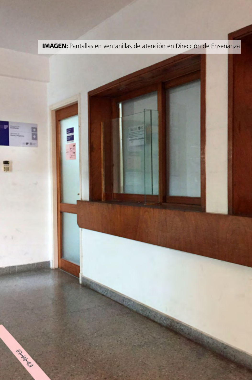
IMAGEN: Pantallas en ventanillas de atención en Dirección de Enseñanza

recepción y ser ingresados por personal de las oficinas. Se deberá coordinar la entrega de los mismos y el grupo que haya hecho el requerimiento, será responsable de recibirlos en el área de recepción que se determine para su correspondiente higiene y desinfección.