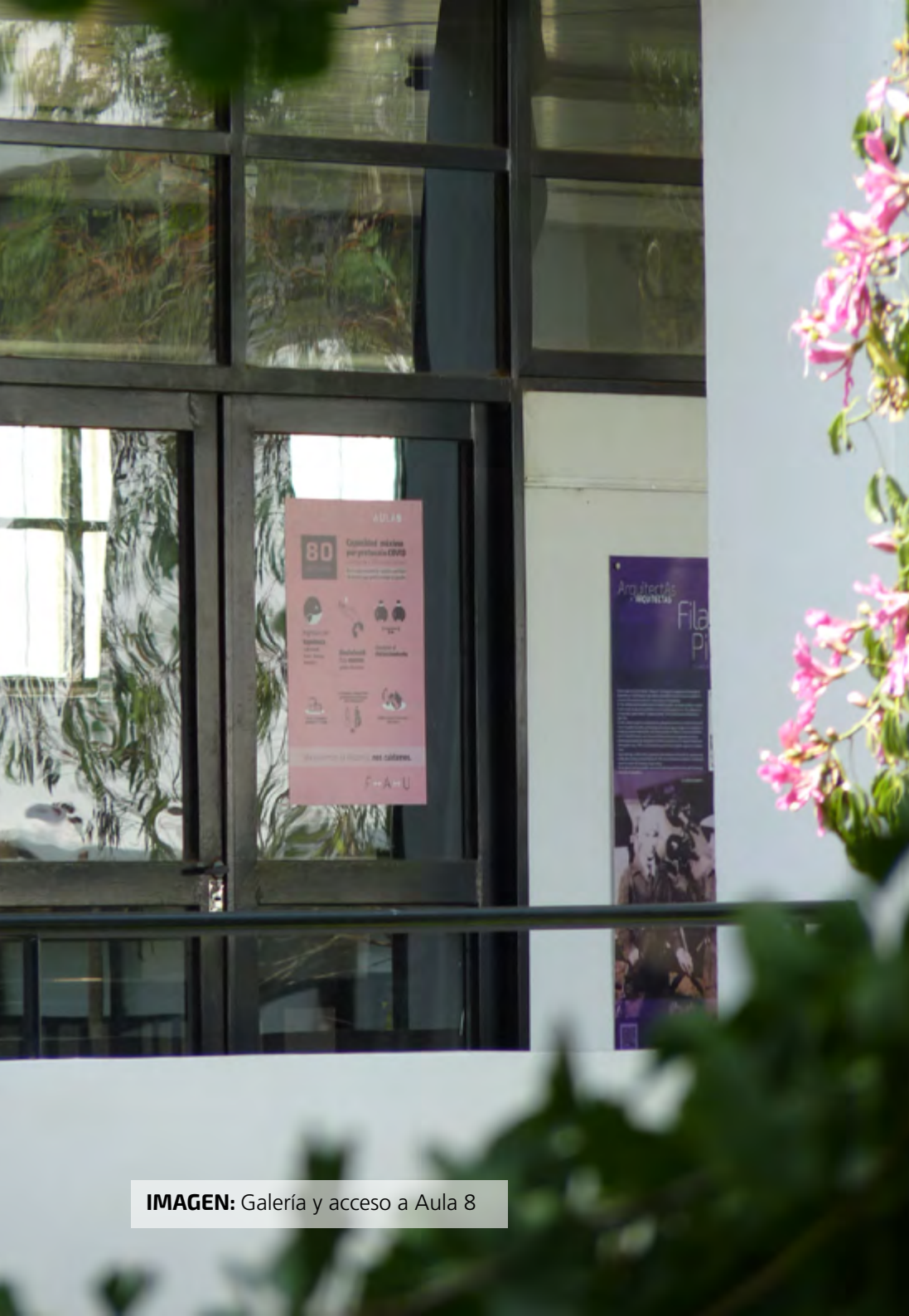
IMAGEN: Galería y acceso a Aula 8