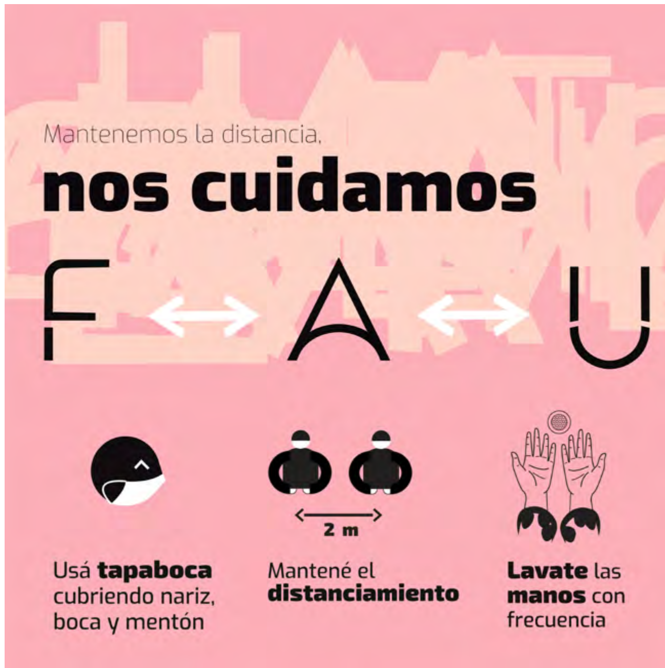
IMAGEN: Pieza para puerta corrediza hall principal