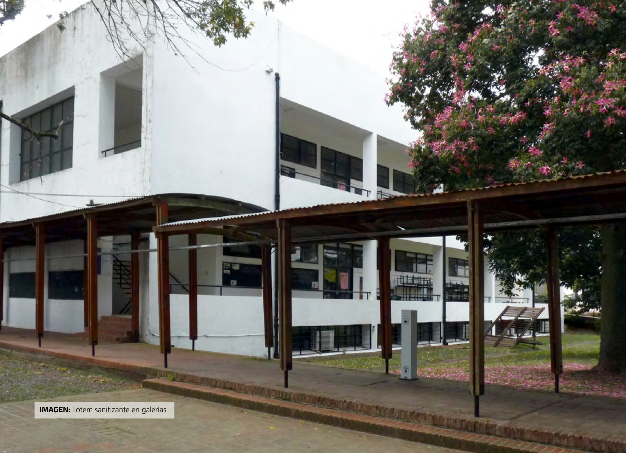
IMAGEN: Tótem sanitizante en galerías