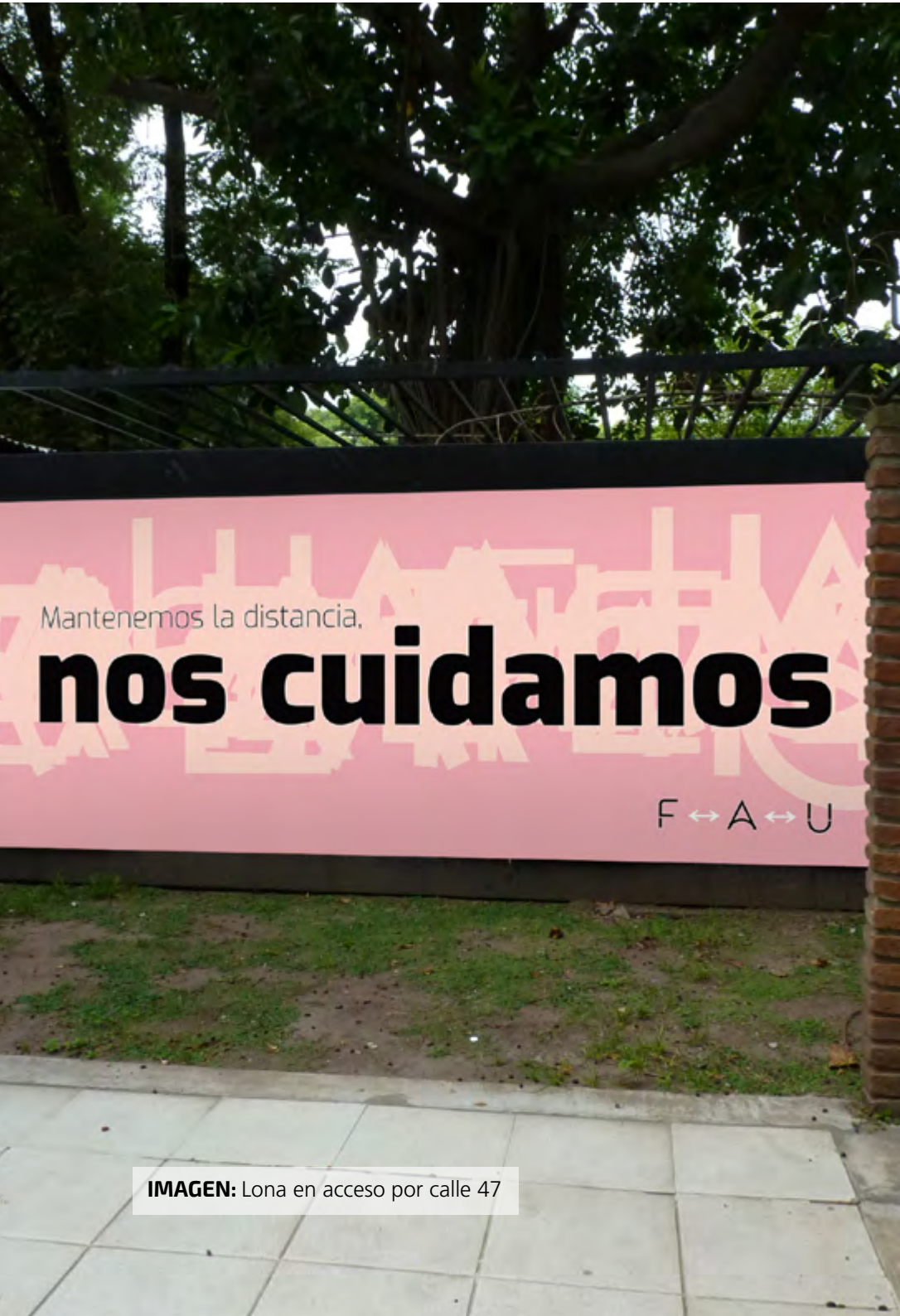
IMAGEN: Lona en acceso por calle 47