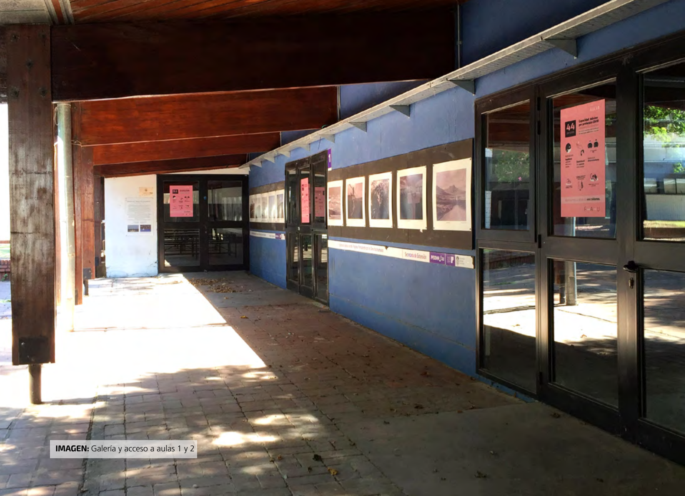
IMAGEN: Galería y acceso a aulas 1 y 2