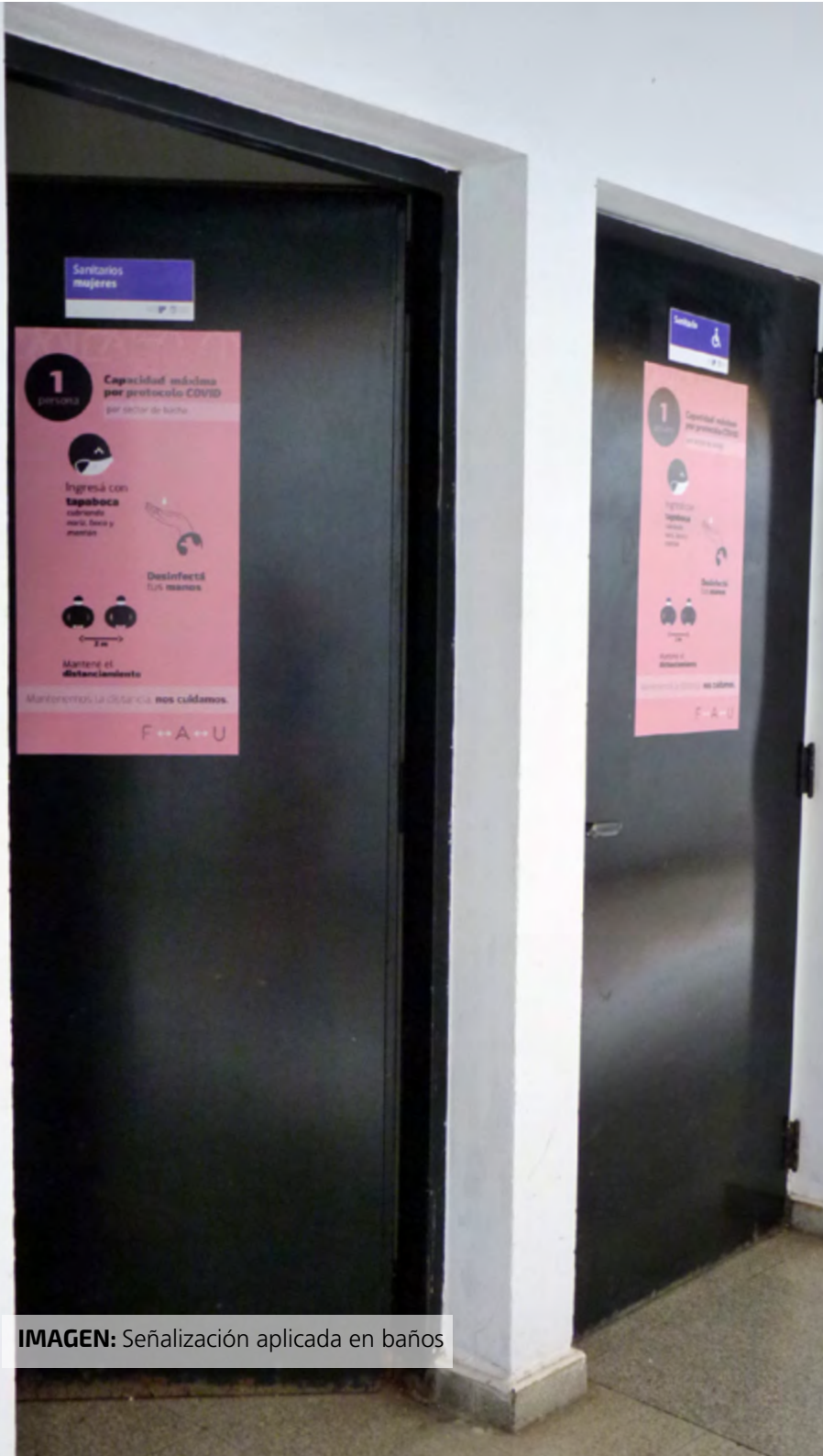
IMAGEN: Señalización aplicada en baños