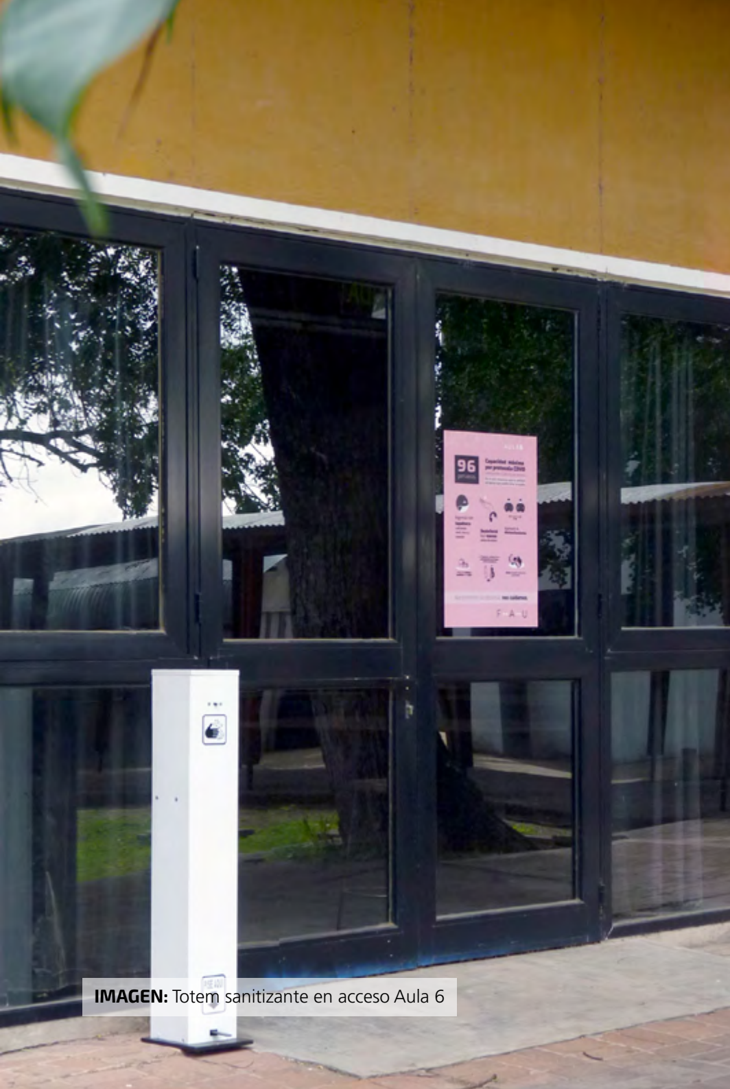
IMAGEN: Totem sanitizante en acceso Aula 6