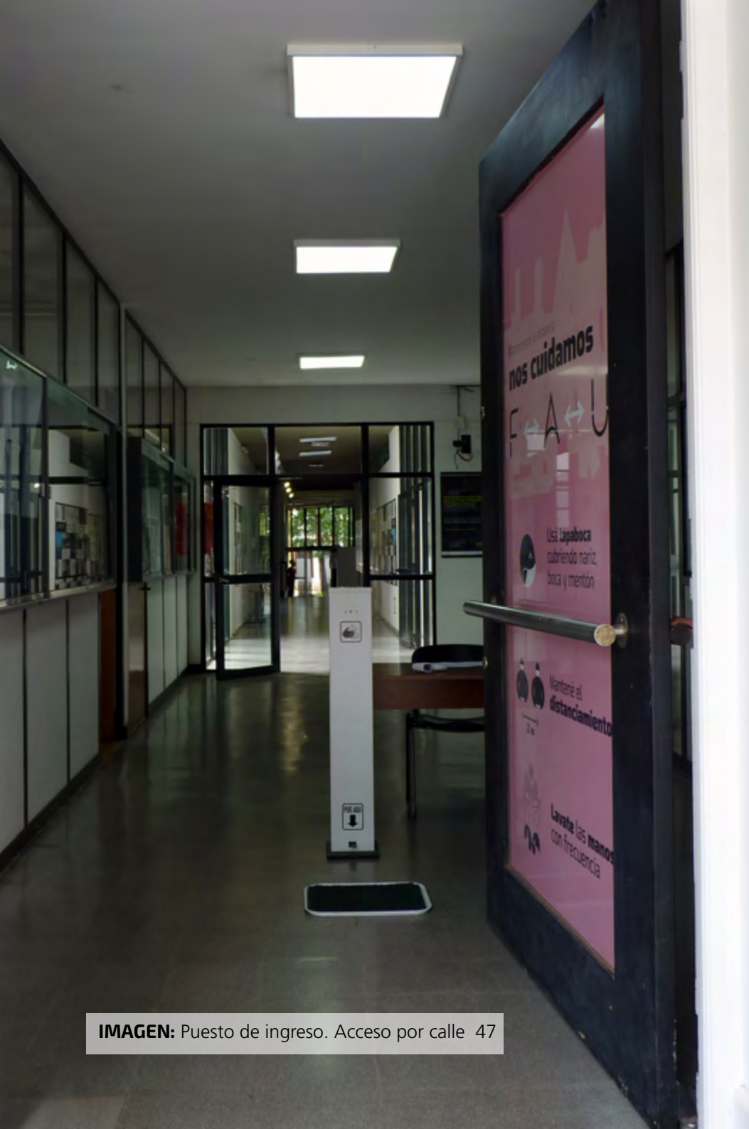
IMAGEN: Puesto de ingreso. Acceso por calle 47